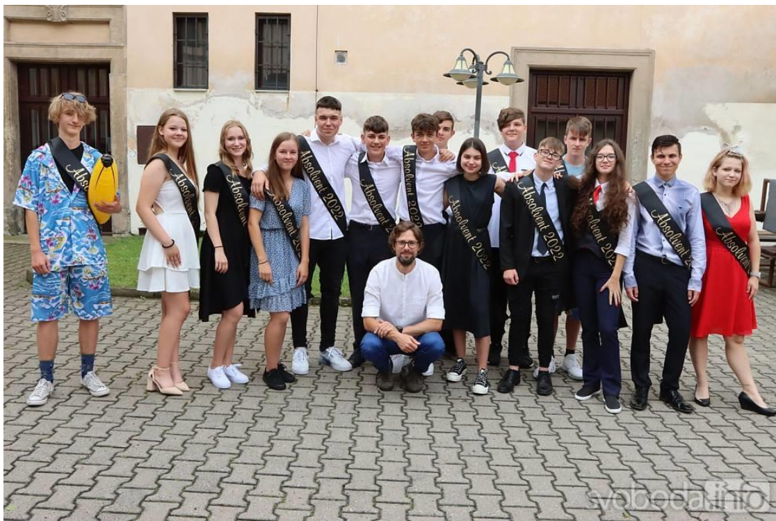
Poslední školní společná