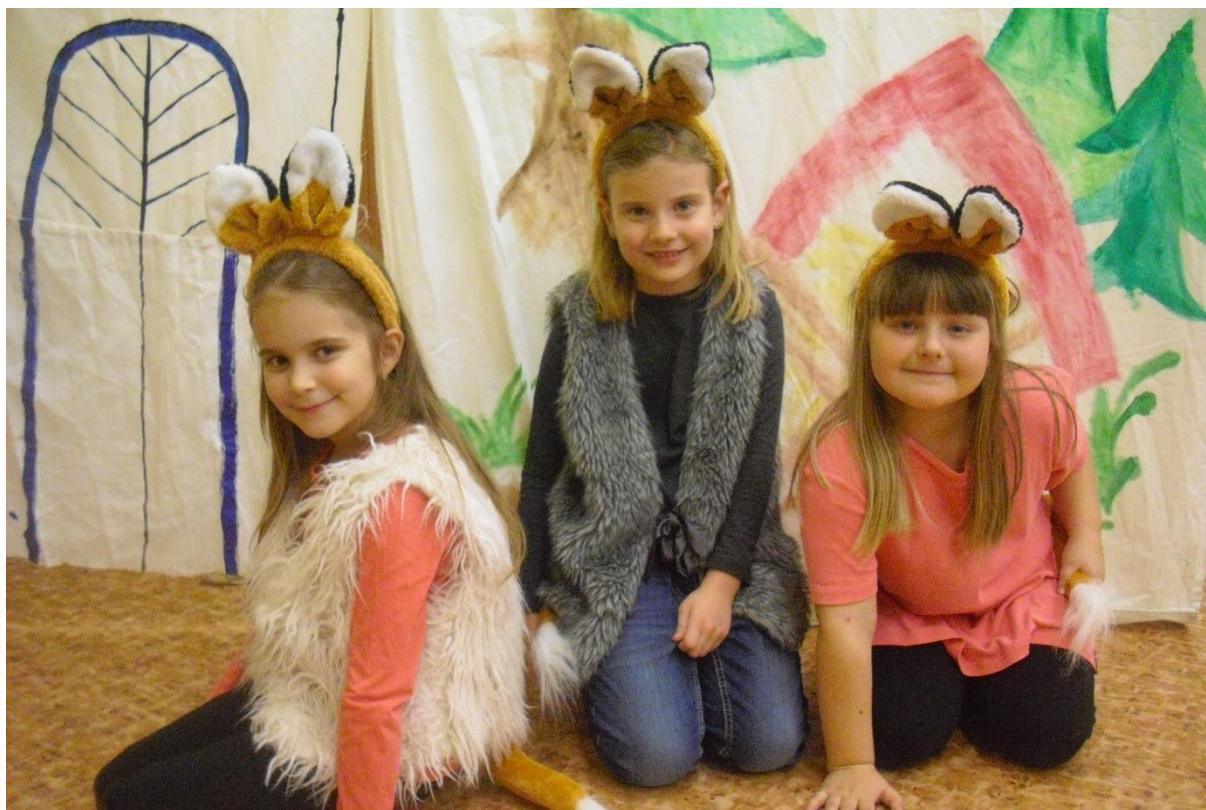
Tyhle lištičky mají za ušima ☺