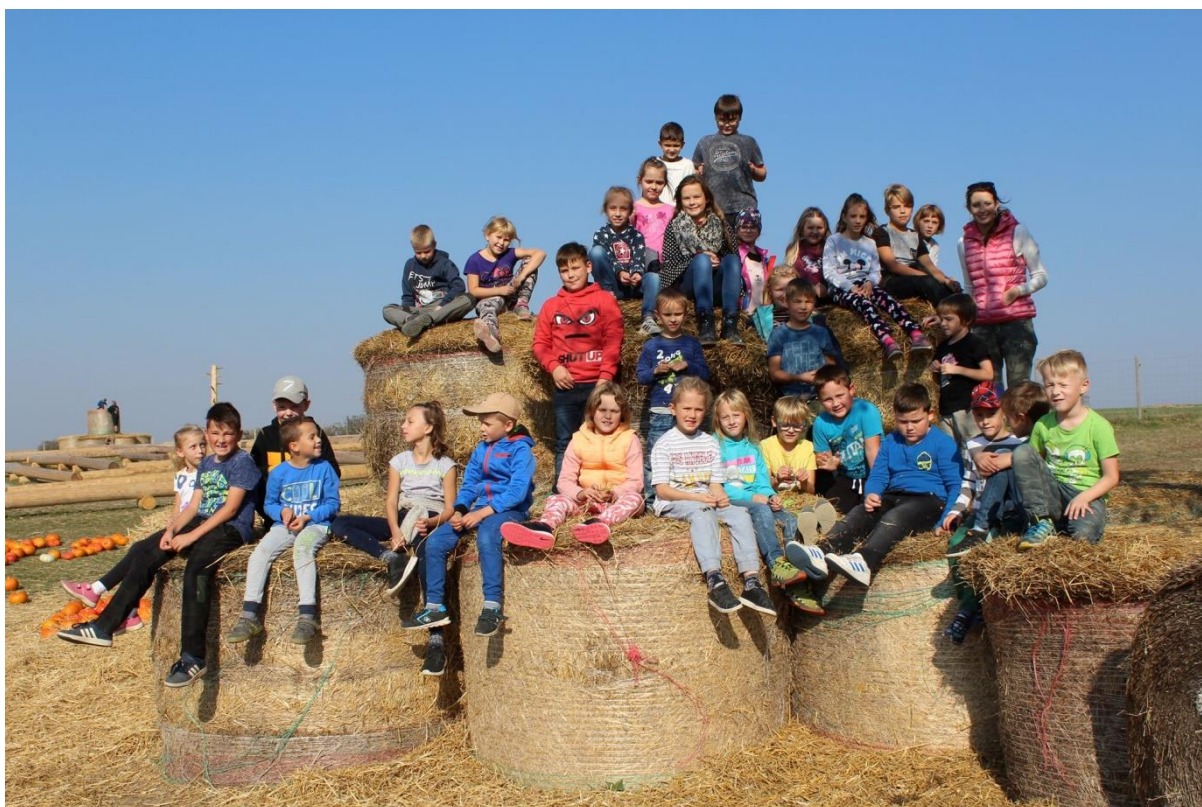
Odpočinek na slámě

Poplatek za školní družinu činil 1000 Kč za školní rok a byl placen pololetně.