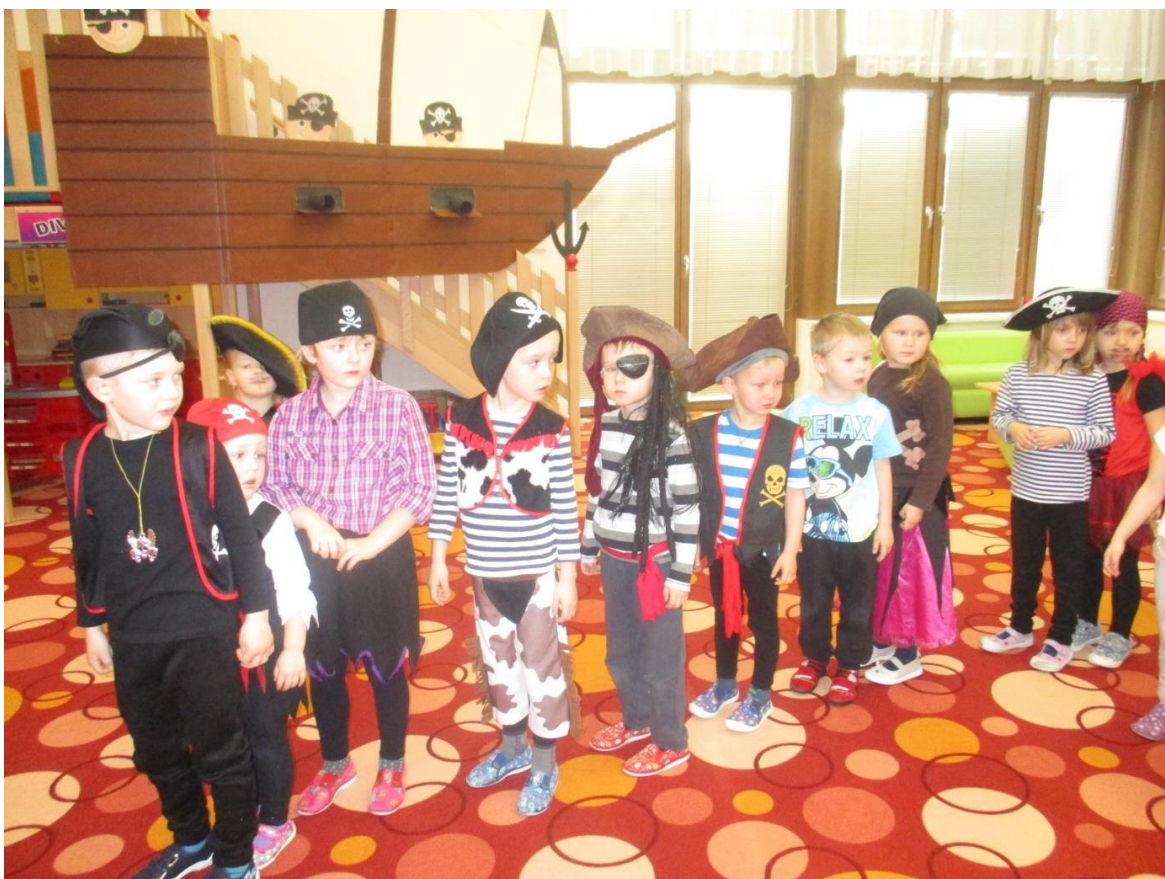
Piráti a námořníci ve školce

divadélko pro školy v ZŠ - předškoláci výlet - společně s 1.tř. ZŠ Kačina - tradice Velikonoc divadlo Kolín - pohádka Dášenska, čili život štěněte divadlo Úsměv v MŠ - Dopravní pohádka návštěva u hasičů v Kolíně s 1.tř. ZŠ divadlo Koloběžka v MŠ - pohádka Šel zahradník do zahrady vystoupení papoušků v sokolovně - společně s dětmi ZŠ smysluplná zahrada Kutná Hora - společně s 1.tř ZŠ žlutý den v MŠ návštěva knihovny v Kutné hoře - setkání s pohádkou výlet do ZOO Dvůr Králové s 1.tř. ZŠ indiánský den v MŠ divadlo Koloběžka v MŠ - Námořnická pohádka pasování předškoláků