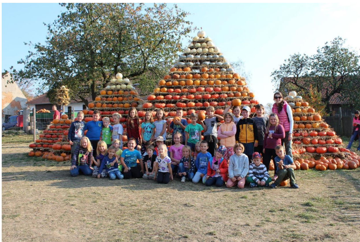
V zajetí dýní