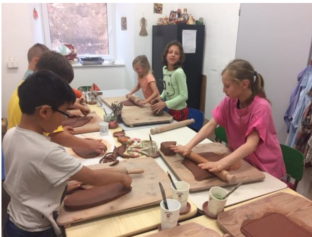
V keramické dílně