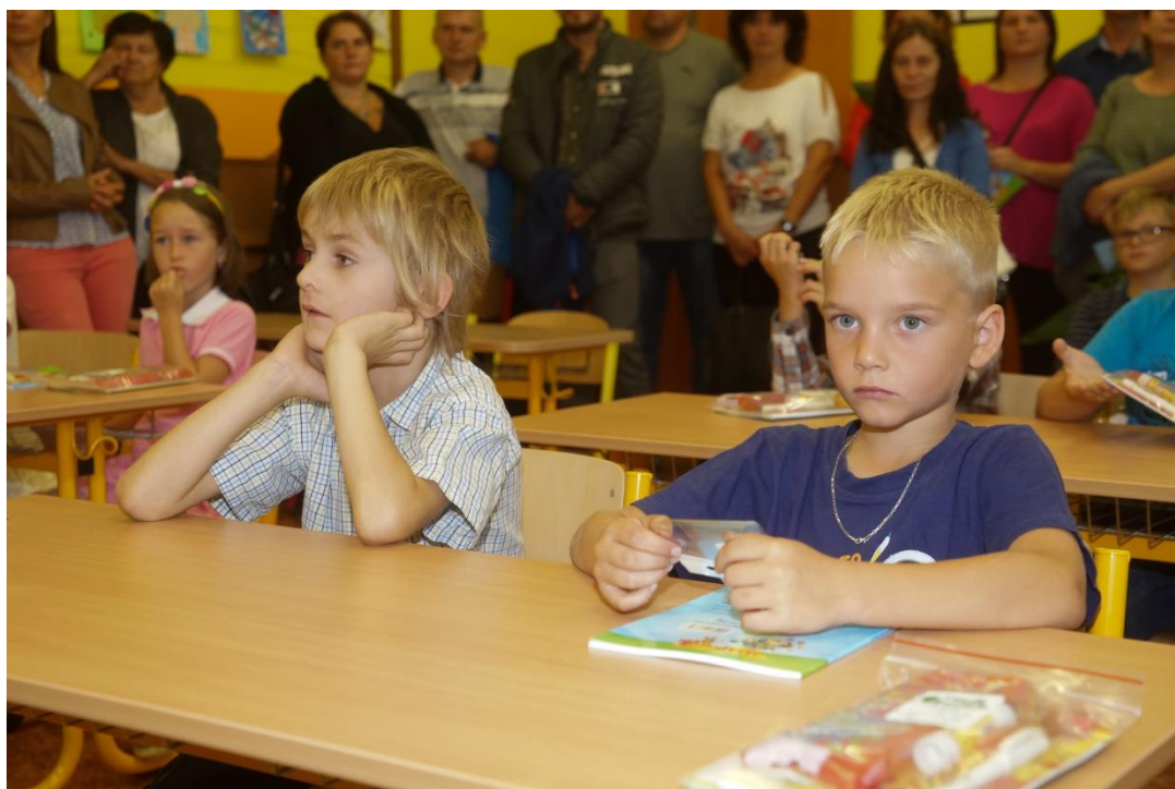
První den ve škole s rodiči za zády

Školní řád a jeho nedílná součást Pravidla pro hodnocení výsledků vzdělávání žáků jsou po projednání v pedagogické radě a Školské radě v platnosti od 1. září 2013. Dílčí úpravy byly opětovně projednány a schváleny na pedagogické radě dne 31. 8. 2015 a následně v listopadu Školskou radou. S veškerými úpravami byli žáci seznámeni v listopadu 2015 a nabyly platnosti 1. 12. 2015. Tyto dokumenty jsou k dispozici ve škole. Výroční zprávu lze najít na webu školy www.zssuchdolkh.cz .