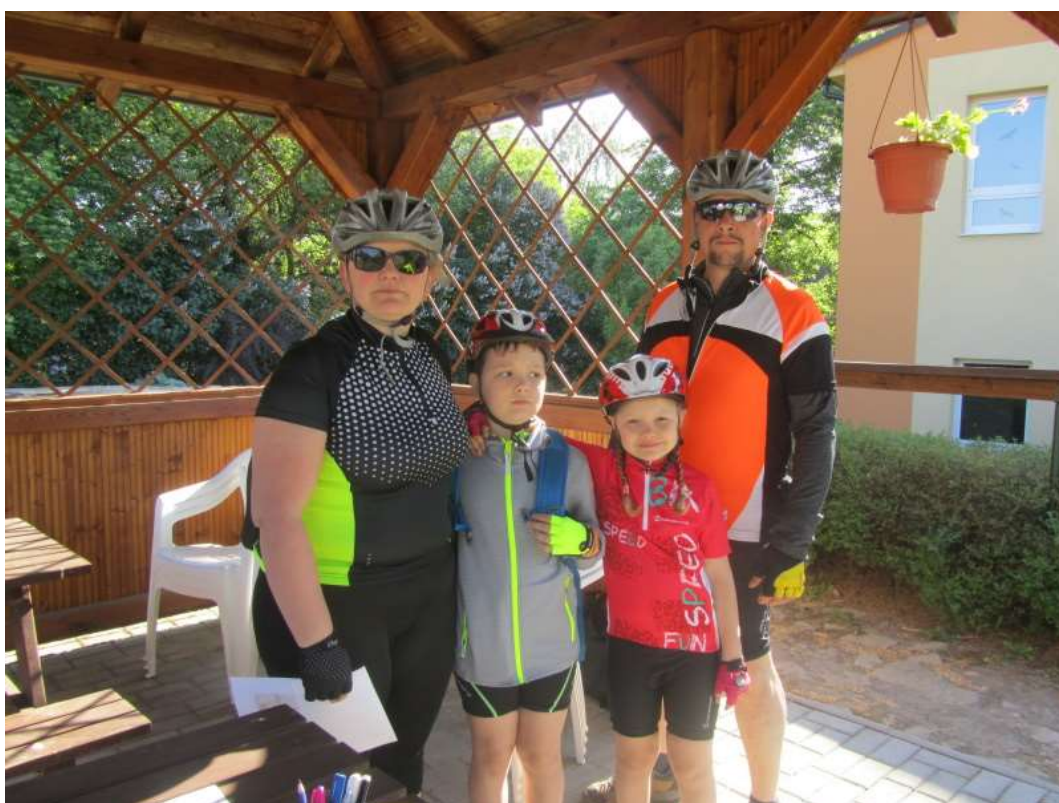
Rodinka před startem

Byl v pořadí již dvanáctý. Opět si přišli na své turisté i vyznavači bicyklů. Pěší trasa vedla po okolních vesnicích přes Malenovice údolím Chotouhovského potoka do Ratboře a přes Sedlov do Suchdola. Cyklisté potkali na trase mnoho pamětihodností a turistických atrakcí. Projeli si krásnou naučnou stezku Na toulkách kolem Kolína, která je zavedla až do Křečhoře k Památníku bitvy u Kolína. Členové turistického kroužku s pomocí paní učitelek nachystali opět pro účastníky malé občerstvení a výstavu, která mapovala jedenáctiletou historii suchdolských pochodů a činnost turistického kroužku od roku 2007. Díky stoupající oblíbenosti pochodu a luxusnímu počasí dorazilo 53 cyklistů a 74 pěších turistů a s nimi 11 psů. Tímto počtem byl překonán rekord z roku 2012, kdy se zúčastnilo 112 osob. Školní soutěž o nejvyšší třídní účast vyhrála 8. třída, která se těšila ze sladké odměny.