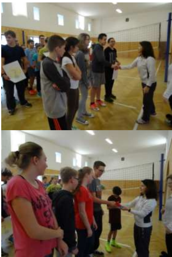
Slavnostní předávání cen