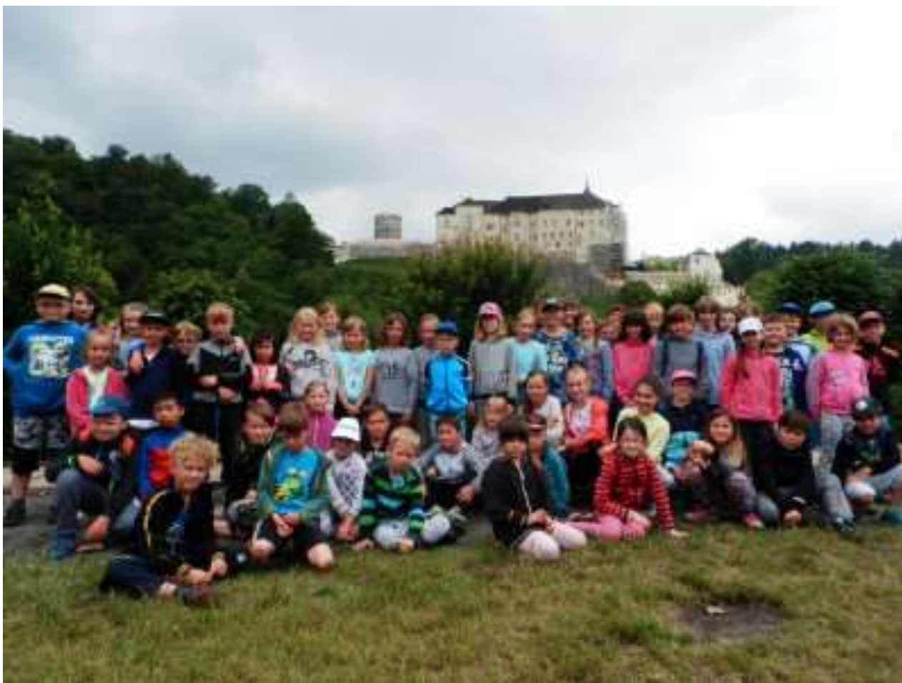
Skupinovka s hradem v pozadí