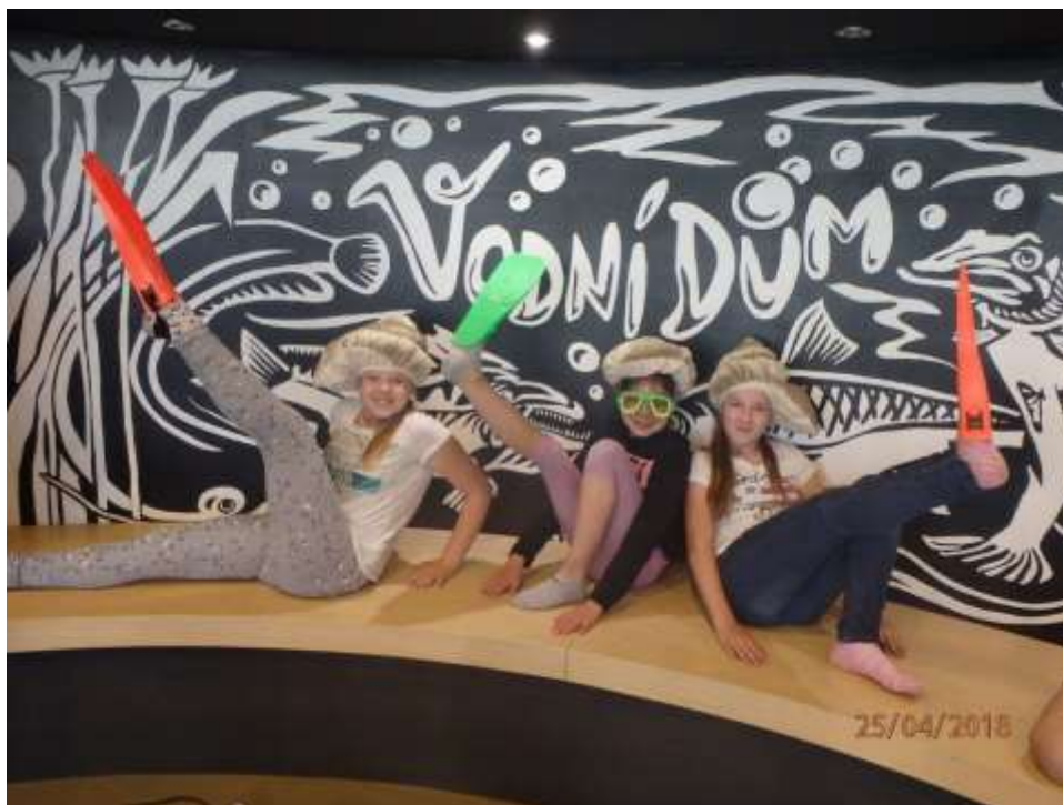
Vodní živočichové v Hulicích

Žáci druhého stupně navštívili Vodní dům v Hulicích. Program byl rozdělen na dvě části. Interiérový program byl veden formou simulační hry na téma povodně. Pomocí hry děti zjistily, že výskyt povodní ovlivníme jen těžko, ale vhodným plánováním krajiny můžeme škodám předcházet. Druhou částí byla výprava s komentovanou prohlídkou na hráz vodního díla Švihov. Budova Vodního domu je zajímavá i z architektonického hlediska, svým minimalistickým stylem a využitím přírodních materiálů skvěle zapadá do okolí a velmi pěkně moderně působí nejen na ekologické, ale i estetické vnímání světa.