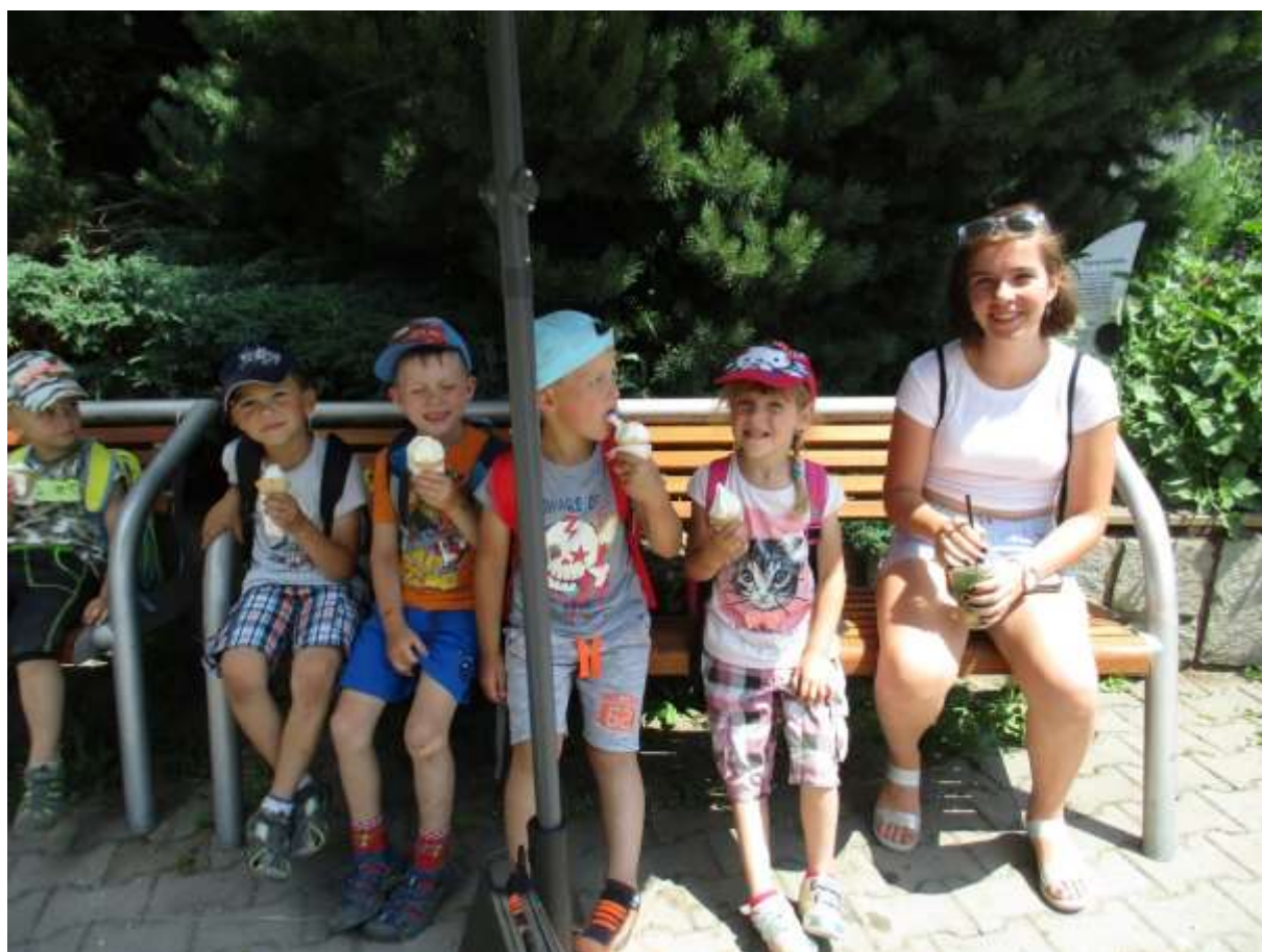
Letní zmrzlinová pohoda