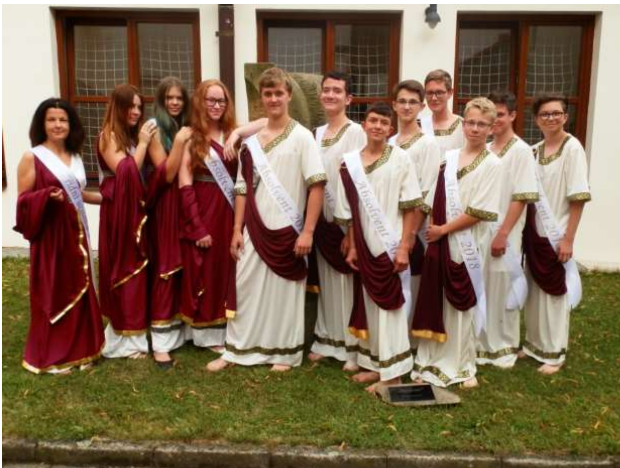
Loučení v antickém stylu