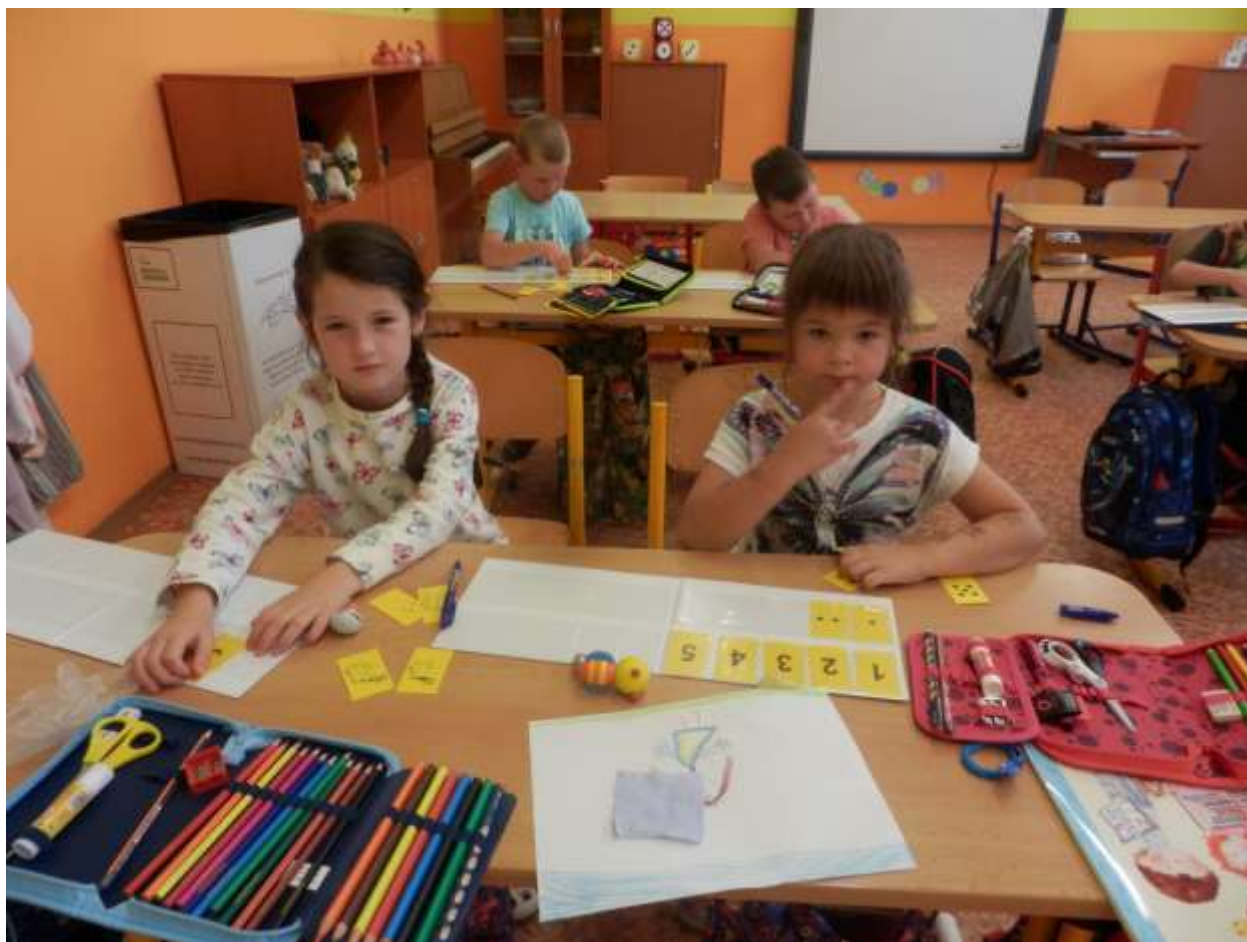
Září v první třídě