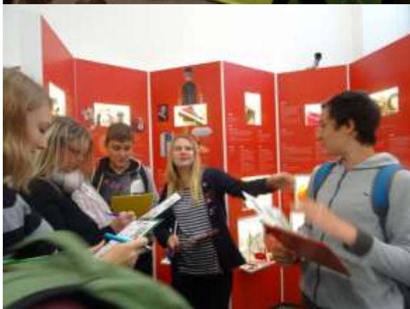
Kreslit umí každý ☺