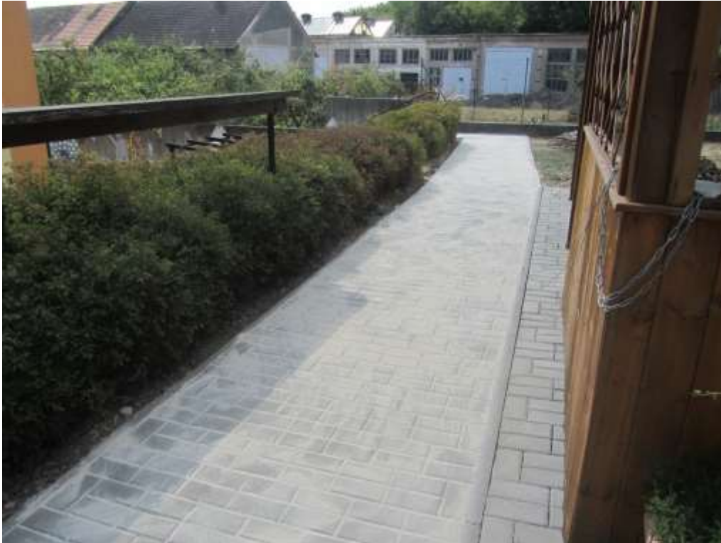
Novinka na naší zahradě