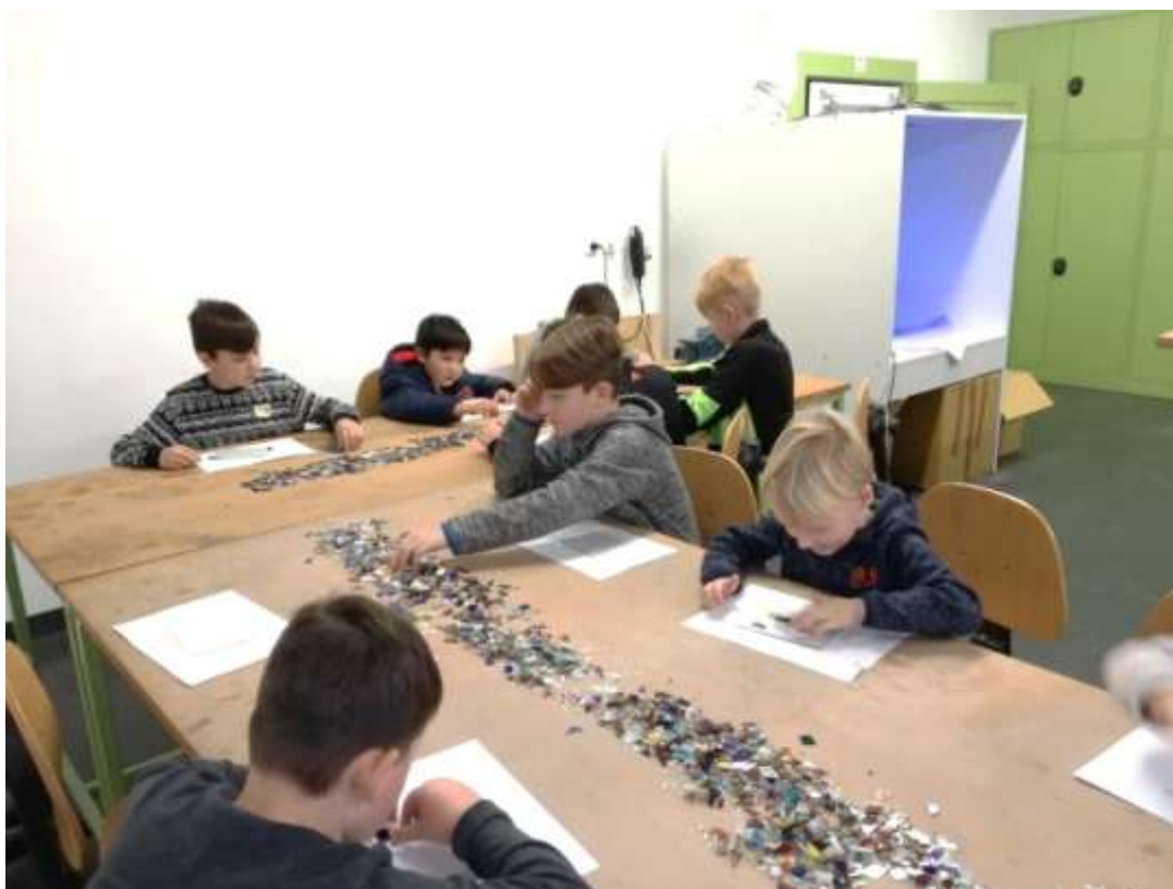
Mozaika vyžaduje fantazii.

V prosinci se školní družina vydala na výlet do Huti František v Sázavě, Centra sklářského umění. V rámci dílniček si zde žáci vyrobili mozaiku ze sklíček nebo metodou pískování na hrneček namalovali obrázek. Součástí výletu byla exkurze a prohlídka sklárny. Tato akce měla u dětí velmi kladný ohlas.