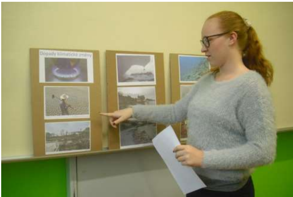
Nela přednáší o klimatických změnách

na obecním úřadě a byla vytvořena výstava, která byla umístěna v relaxačním koutku ve škole. V zimě se též starali o ptáky a pravidelně je krmili ve školních krmítkách. V jarním období se připravovali na přírodovědnou soutěž Zlatý list a starali se o záhonky na školní zahradě.