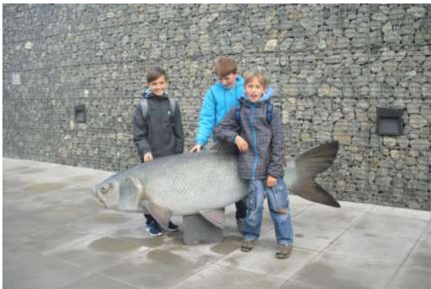
Vodní dům v Hulicích – pěkný úlovek!

Každoročně opakujeme jarní úklid kolem obce . Děti sbíraly odpadky v příkopech a na veřejných prostorech. Podílely se tak na zlepšení životního prostředí a posílily svůj vztah k místu, kde žijí a k okolní přírodě.