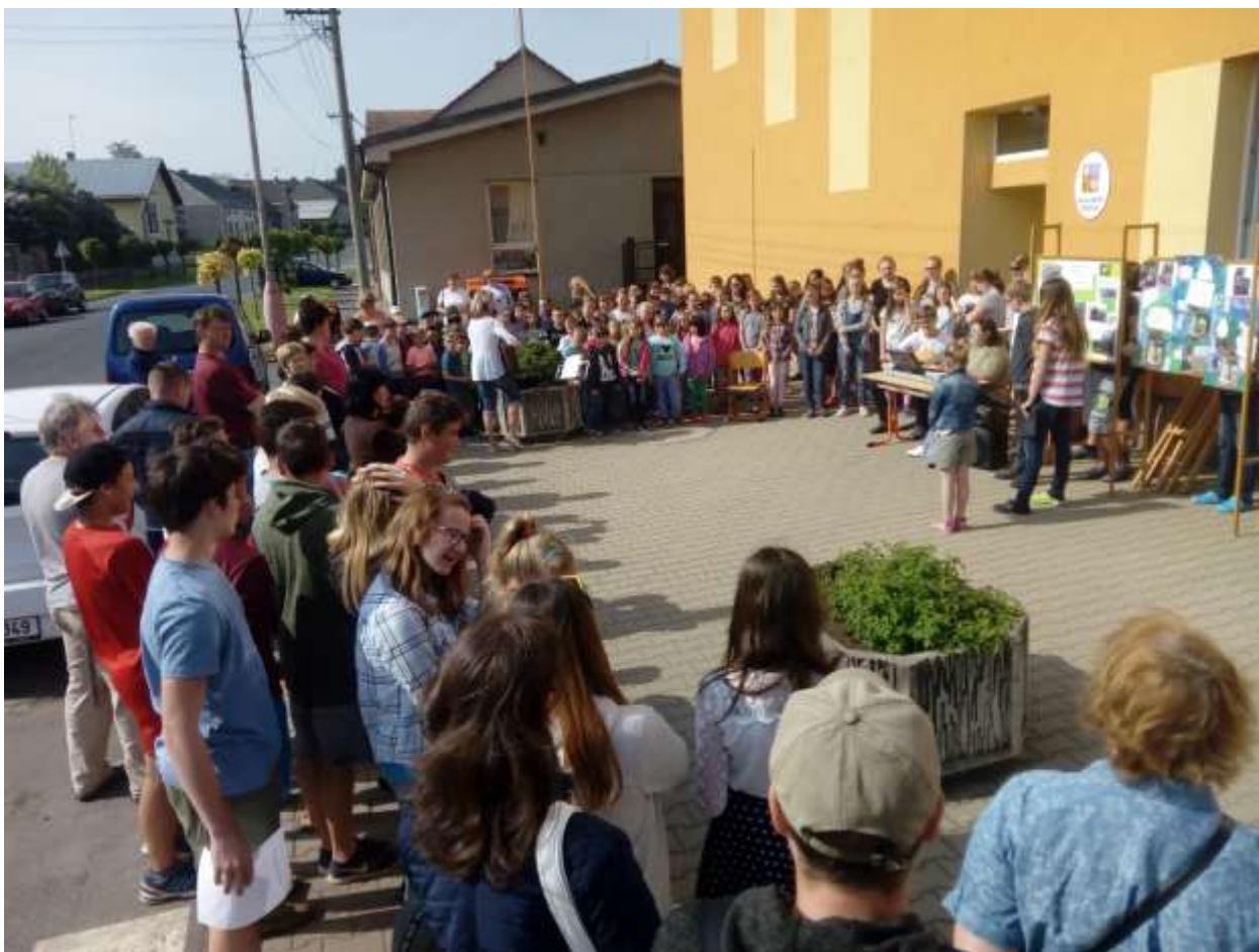
Slavnostní okamžiky - malá vernisáž před školou

V práci na tomto tématu budeme pokračovat na podzim příštího školního roku v říjnu, kdy plánujeme slavnostní označení školního stromu.