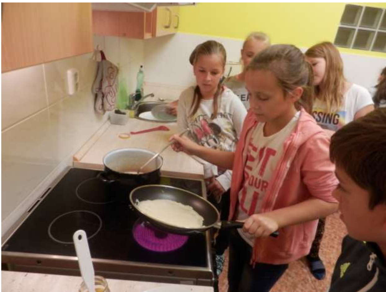
Příprava sladkého pohoštění

Žáci 6. třídy v průběhu dne zpracovávali téma "Exotické ovoce". V prvních dvou hodinách si ve školní kuchyňce připravovali zdravé svačinky z exotického ovoce. Poté byli s jednotlivými druhy seznámeni, ovoce poznávali, a také ochutnávali. V další části dne vyhledávali informace o původu, pěstování exotického ovoce a zeleniny. Tyto informace zpracovali do dokumentu. V poslední hodině vytvořili kuchařku s recepty z exotického ovoce a zeleniny.