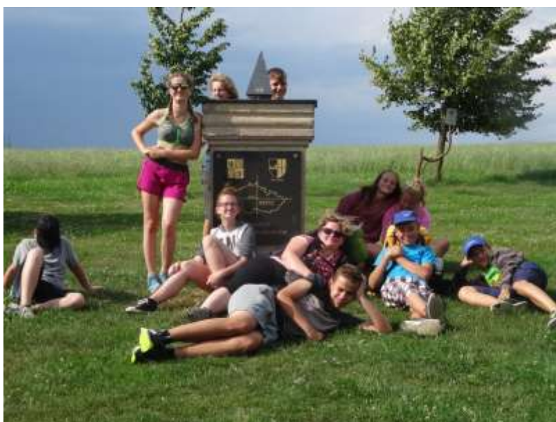
Dobyli jsme střed republiky!

Na konci školního roku žáci prvního stupně vyjeli na školu v přírodě a druhý stupeň zařadil výlety do přírody a turistický kurz pro šestou třídu.