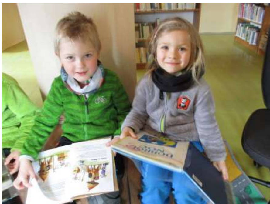
Návštěva knihovny v Kutné Hoře

Návštěva knihovny v Kutné Hoře – čtení o strašidlech