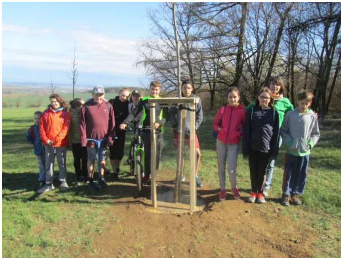
Školní lípa zasazena a zalita!

Na začátku nápadu zrealizovat projektový den na toto téma stáli dobřešští hasiči. U příležitosti stého výročí od vzniku Československa vyhlásili akci „Zasad' si svůj strom“. Této nabídce využily děti z turistického a environmentálního kroužku a spolu s dalšími spolužáky v sobotu 14.4.2018 vysadily školní lípu na vrchu Vysoká. Lípa srdčitá byla zakoupena z peněz za sběr papíru, bylin a dalších druhotných surovin.