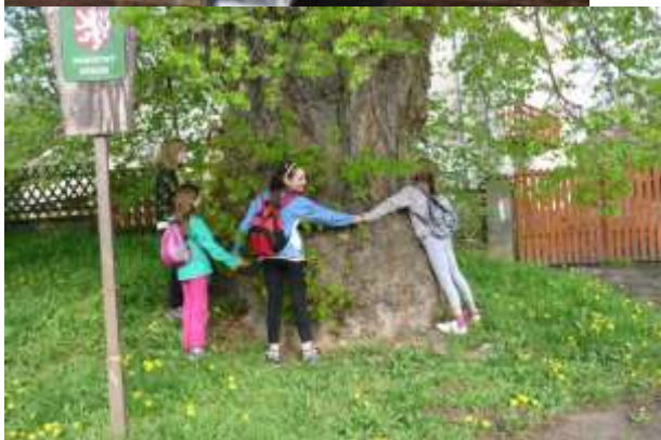
Voda, ta nás baví!