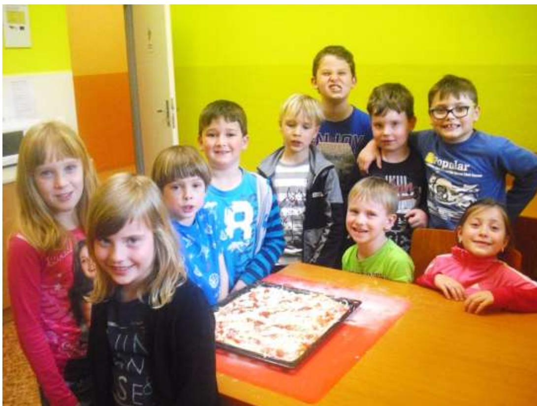
Upekli jsme si pizzu!