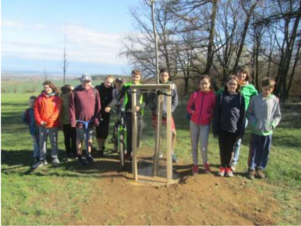
Naše školní lípa. Ať roste do krásy a síly!