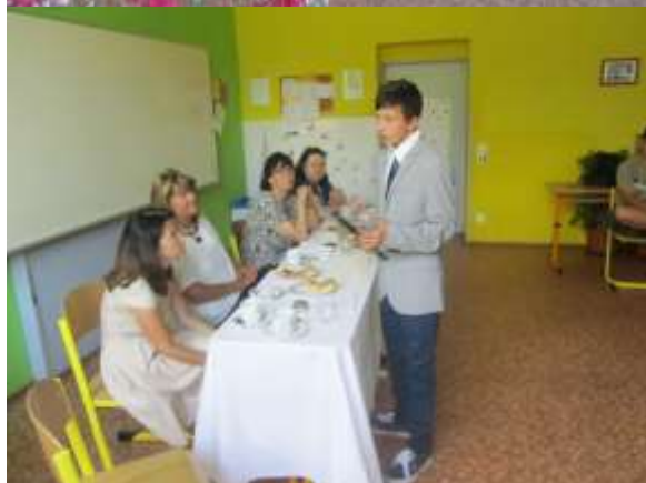
Složit Rubikovu kostku není problém