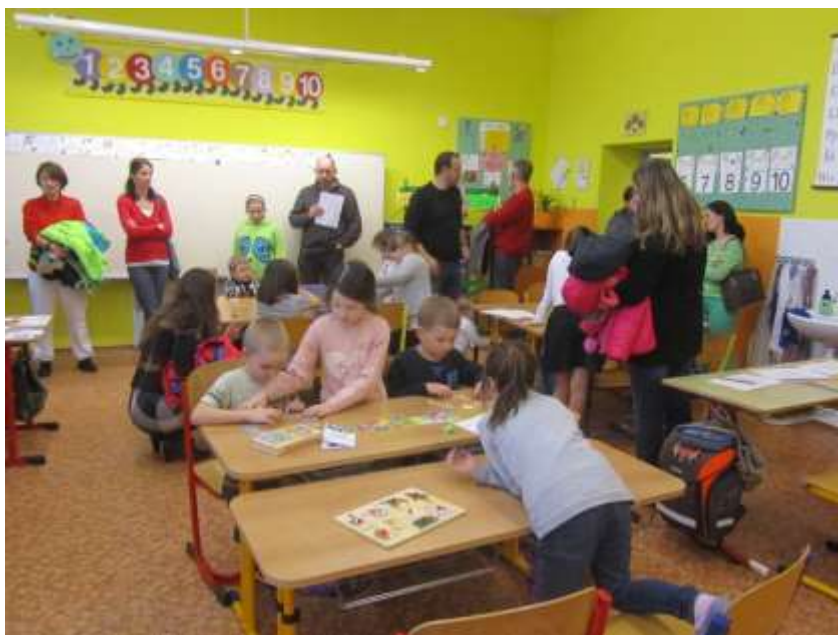
Předškoláci se už těší do školy