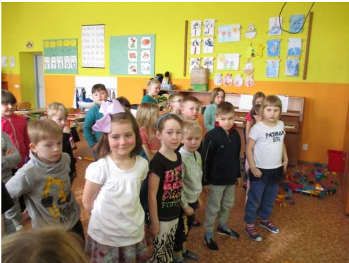
Návštěva v 1. třídě