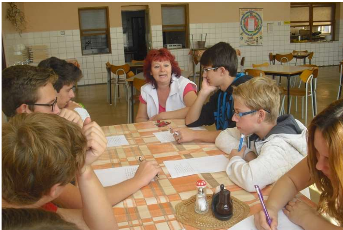
Vedoucí školní jídelny pod palbou otázek

školního stravování. K tomuto tématu si připravili tematické otázky, se kterými se v den projektové výuky obrátili na vedoucí školní jídelny. Rozhovor žáků a paní vedoucí probíhal v prostorách jídelny. Žáci se mimo jiné dozvěděli, že jídla ve školní jídelně musí splňovat příslušné normy a zásady. Musí mít vhodnou výživovou hodnotu, odpovídat možnostem jídelny a také se vejít do rozpočtu. V závěru rozhovoru se žáci s vedoucí jídelny dohodli na spolupráci. V hodinách výchovy ke zdraví budou připravovat recepty odpovídající normám a zásadám zdravého stravování. Tyto recepty předají vedoucí jídelny, která je bude zařazovat do školního jídelníčku.