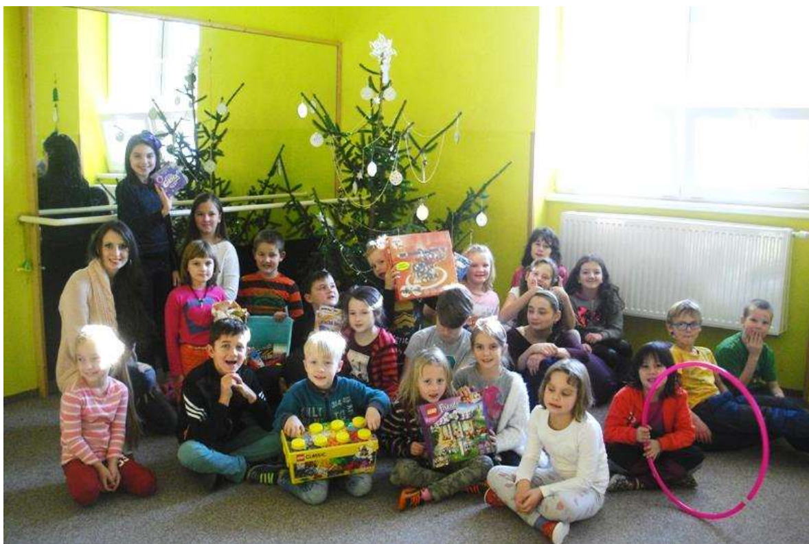
Vánoční nadílka pro hodné děti