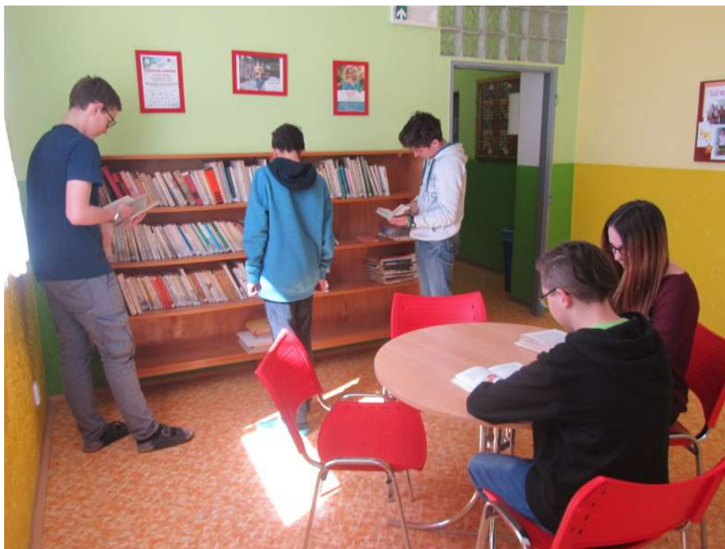
Nová knihovna pro žáky