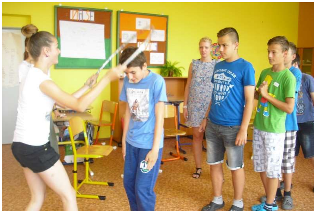
Hrátky s Prostorem