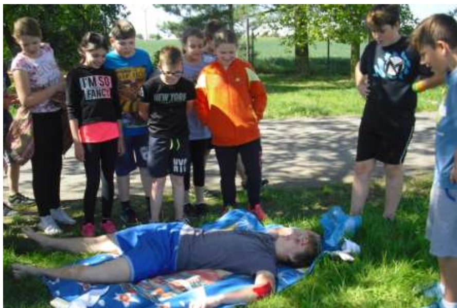
Zranění vypadala hrozně

Osmáci se v průběhu dne věnovali testům a pravidlům silničního provozu. V praxi zkoušeli vyhodnocovat dopravní situaci na místní komunikaci. Dále pomocí kampaně "Nemyslíš, zaplatíš" diskutovali nad významem TV spotů.